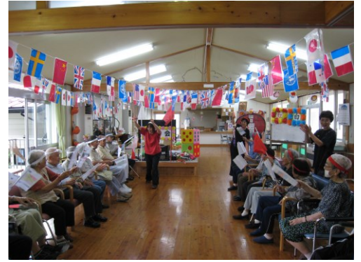
歓声で盛り上がった運動会