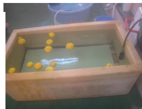
利用者さんに頂いた 柚子で温まりました