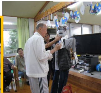
豊作を願って案山子づくりに挑戦

家族への日頃の感謝の気持ちを言葉にしました。 受け取った方の喜ぶ顔を思い浮かべ、照れくさそうにはがきにしたためていました。