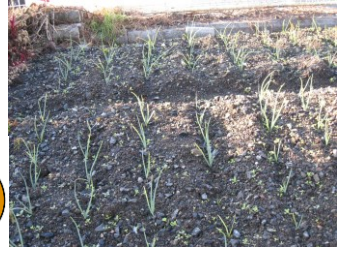
デイの畑に玉ねぎを植えました