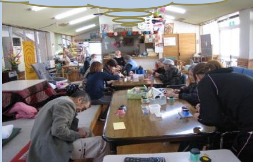
みんなで、ひな人形を作成中。