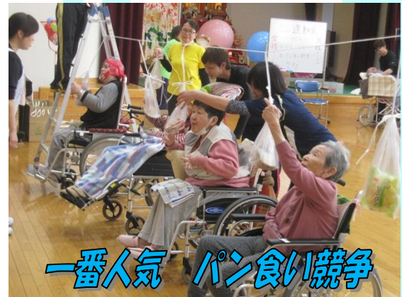
一番人気 パン食い競争