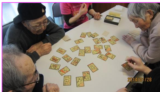
【いろはカルタ遊び】