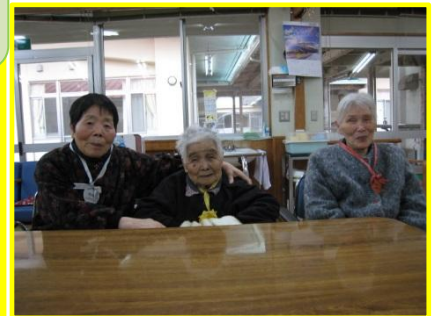
金・銀・銅メダル獲得