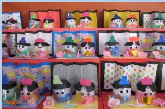
可愛いひな人形の出来上がり