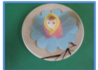
ひなまつりおやつ