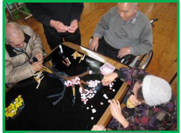
完成目指して貼り絵に挑戦