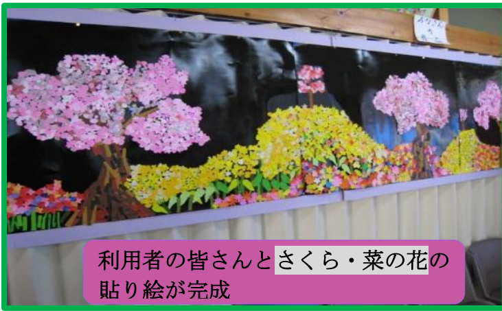
利用者の皆さんとさくら・菜の花の貼り絵が完成