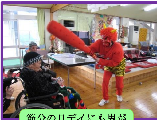
節分の日デイにも鬼が現れみんなで鬼退治。